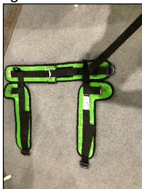
Bungee trambulín heveder